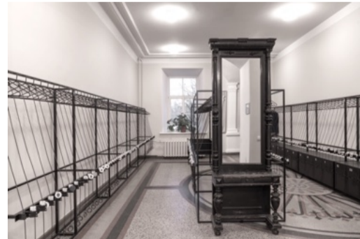
MUZIKOS IR TEATRO AKADEMIJOS rūbinė