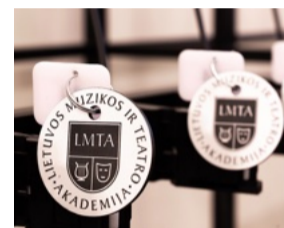
Rakto pakabukas LMTA rūbinė

Mūsų komanda pasiruošusi pakonsultuoti jus dėl tinkamiausio užraktų tipo, konstrukcijos. Esant poreikiui atvyksime pamatuoti patalpų ir suprojektavę pateiksime jums optimaliausią rūbinės sprendimą.