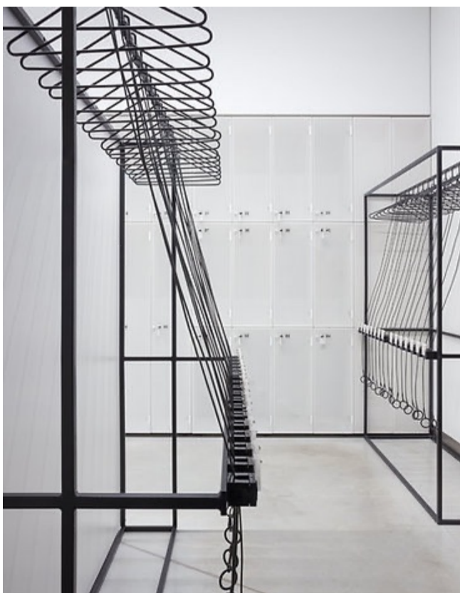
MO muziejaus rūbinė

Mūsų komanda pasiruošusi pakonsultuoti jus dėl tinkamiausio užraktų tipo, konstrukcijos. Esant poreikiui atvyksime pamatuoti patalpų ir suprojektavę pateiksime jums optimaliausią rūbinės sprendimą.